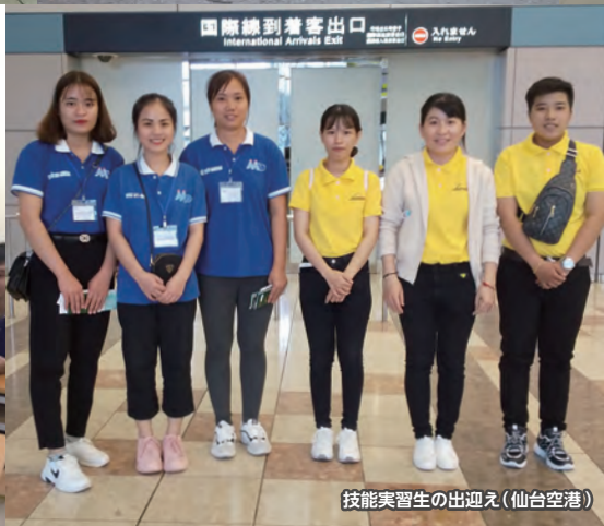
技能実習生の出迎え(仙台空港)