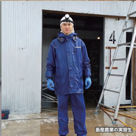
畜産農業の実習生