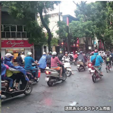
活気あふれるベトナム市街