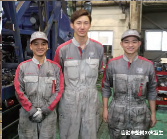
自動車整備の実習生

経済産業省・国土交通省・文部科学省・岩手県認可 外国人技能実習生受入事業 特定監理団体 許可番号：許1702000170号