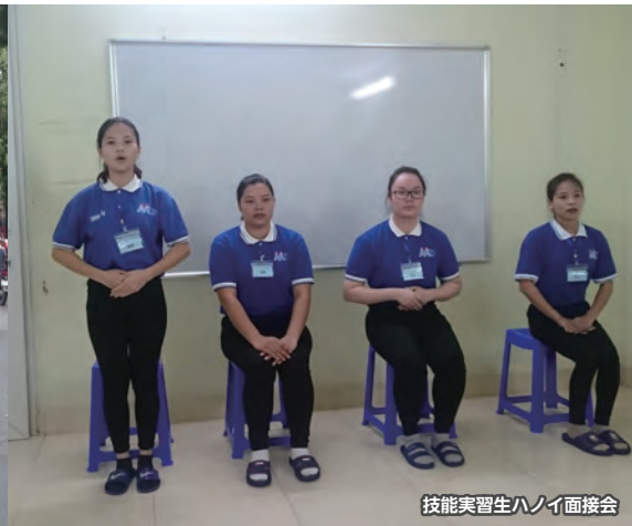
技能実習生ハノイ面接会