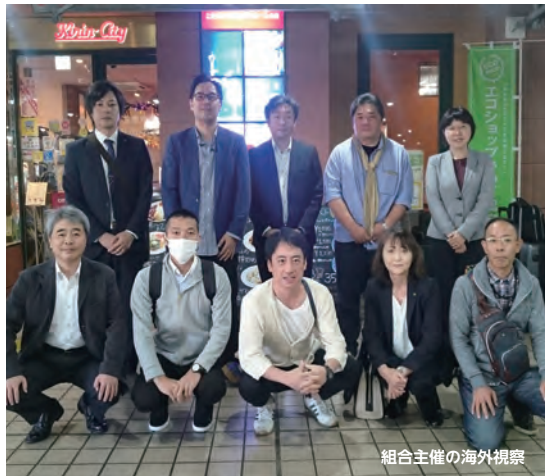
組合主催の海外視察