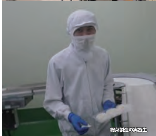
総菜製造の実習生